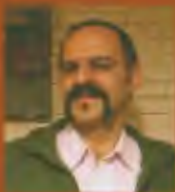
سید فضل الله (کمال) طباطبایی