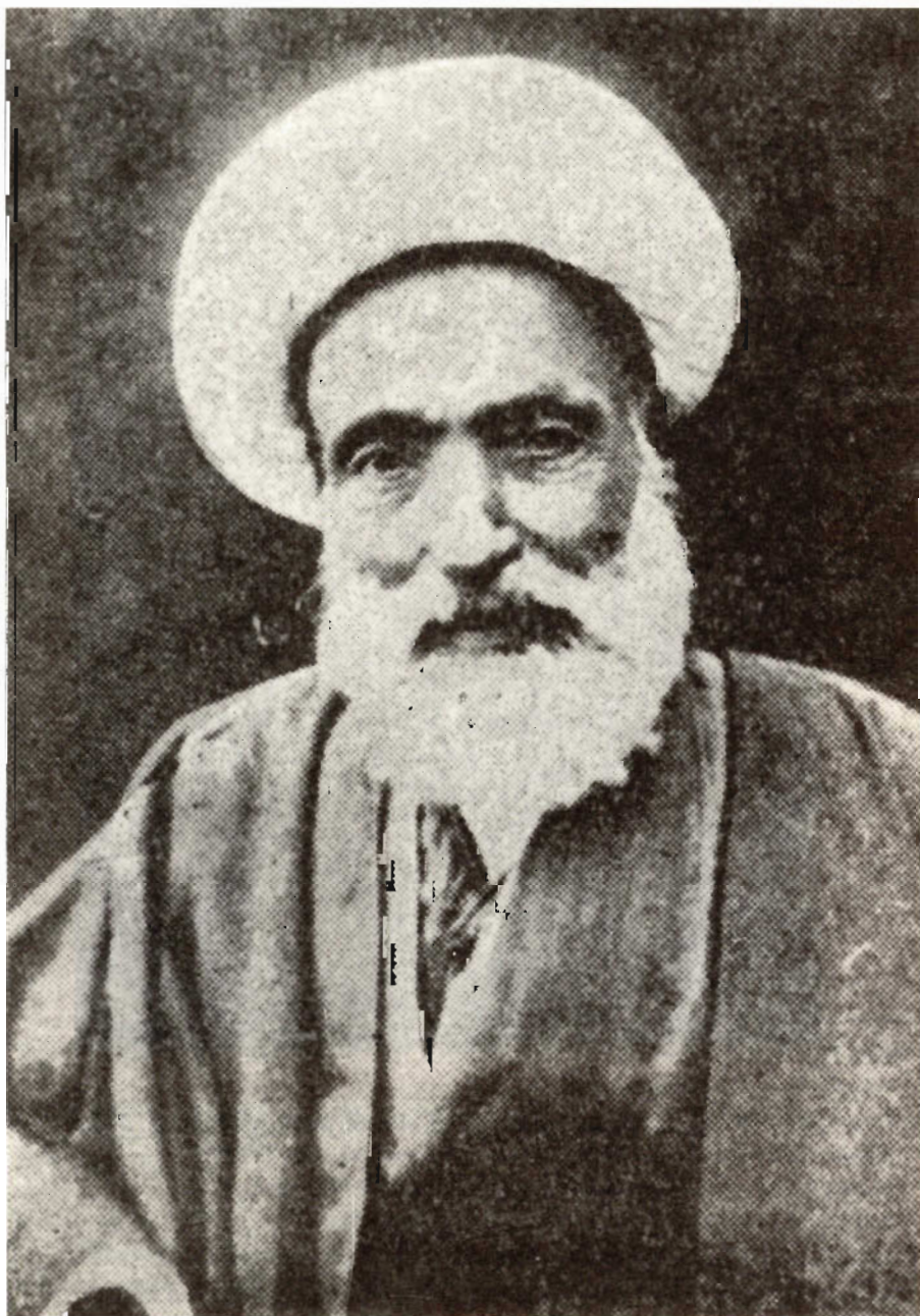
تصویر دیگری از وی که سال عکسبرداری آن معلوم نیست.