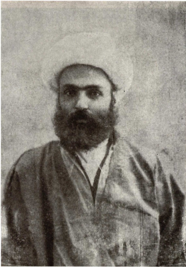
تصویر جناب آقای شمس العلماء گرکانی که در حدود سال ۱۳۰۸ هـ. ق در شهر پونه هندوستان برداشته شده است.