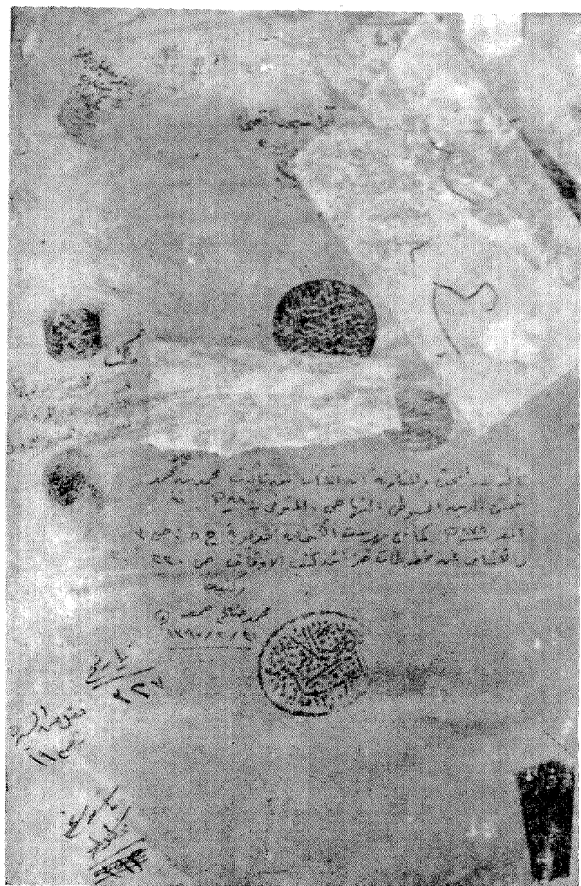
لوحة رقم (٤)